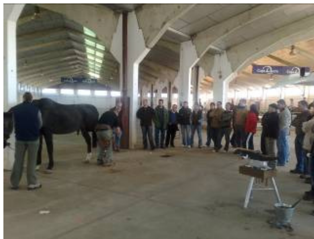
II Curso Básico de Herraje, organizado por CESCOLE, en 2008, con gran aceptación por parte de numerosos aficionados.

16,30 h. Aplomado y Herrado correctivo de desviaciones y defectos mas comunes.