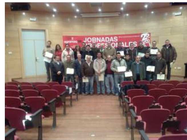
Foto de grupo tras la entrega de diplomas en el I Curso Básico de Herraje organizado por CESCOLE, en noviembre de 2008.